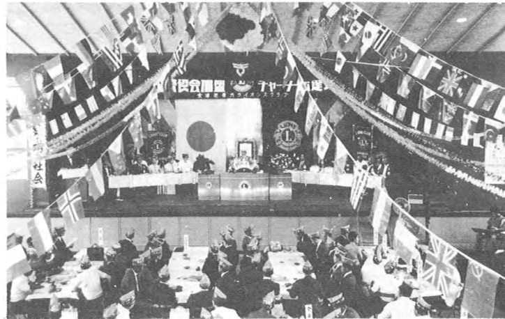
栄えある日本1,144番目の承認状伝達式 (42.8.6 於厚生会館)