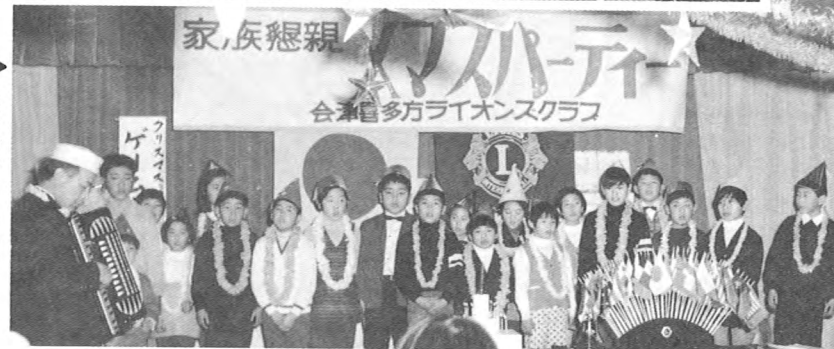
家族懇親クリスマスパーティー (12月)