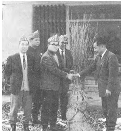
▼ 老人ホームに桜の苗木40本 (44.11)