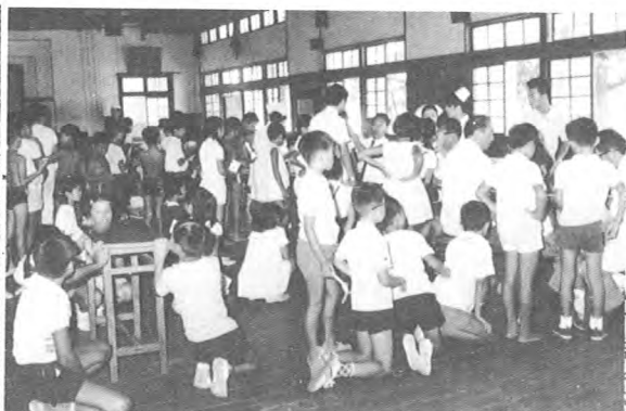
喜多方市立第一小学校での血液判定(9月)