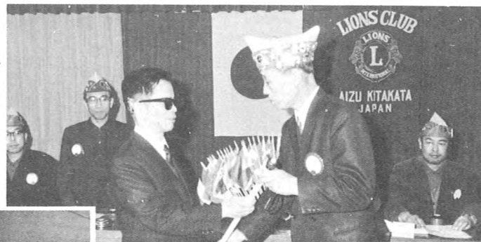
▲ 市内の盲人の皆さん21名に折たたみ ブラッシュ付白杖贈る(44.2)