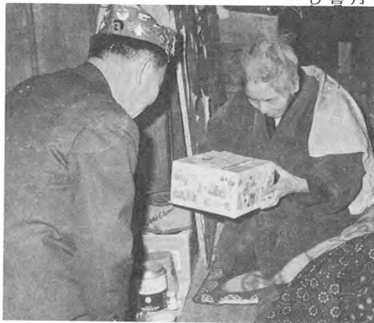
寝たきり老人、身体障害者訪問(12月)