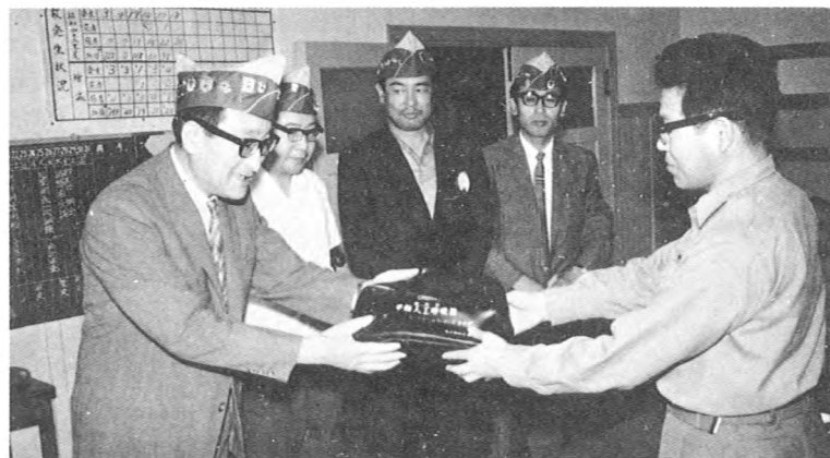
警察署に人工呼吸器を贈る（7月）