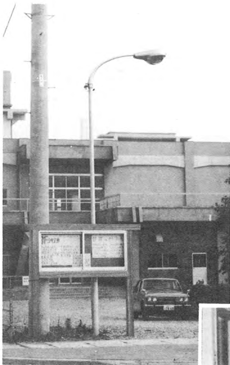
図書館前に水銀灯を建てる (47.5)