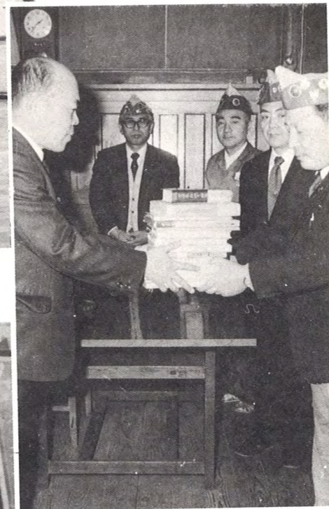
僻地学校へ図書贈呈（11月）