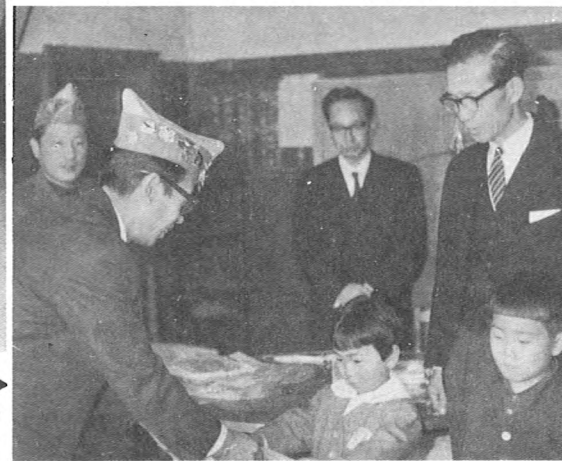
▶ 黄色のランドセルカバーをどうぞ、 交通事故にあわないようにネ (44.3)