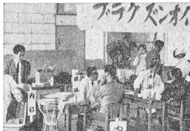
無医地区民を診療奉仕するライオンズ・ク