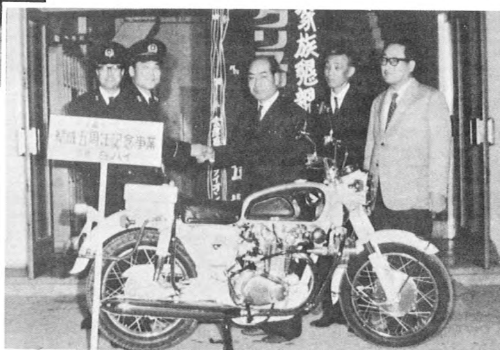
交通事故防止のため警察署へ白バイ贈る (46.11)