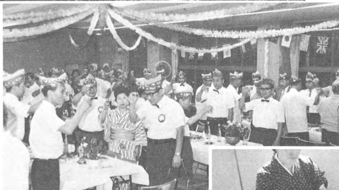
▶ 皆んなでチャーターナイト 一周年の喜びを分かちあう (43・8・6)