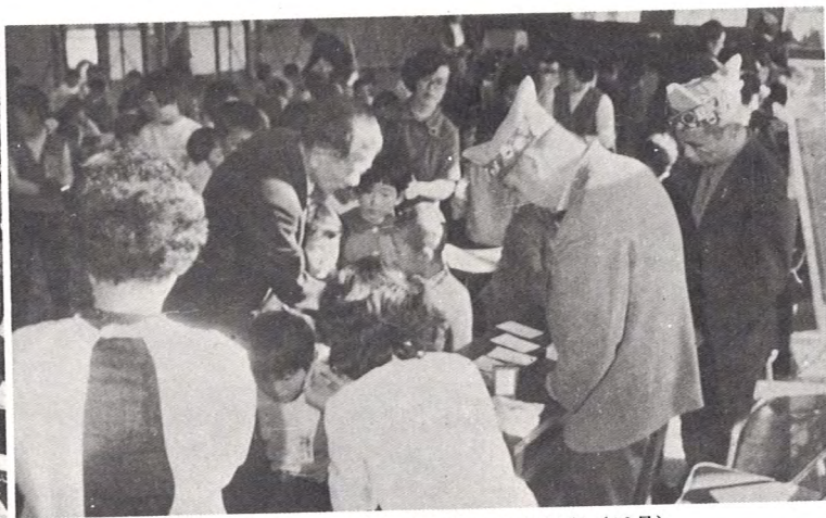
山都町立山都第一小学校全生徒の血液判定（10月）