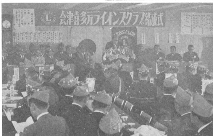
▲ 来賓多数を迎えての結成式典 (41.11.27)