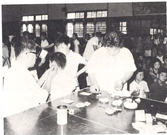
喜多方市立第一小学校血液判定（9月）