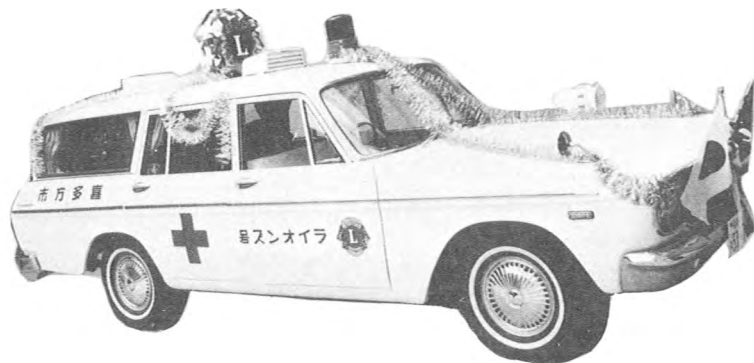
チャーターナイト記念アクティビティー 市に救急車を贈る