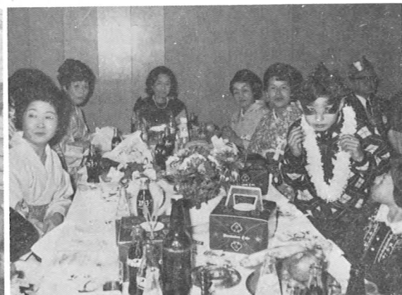
▲ 第1回家族懇親クリスマスパーティー (41.12.18)