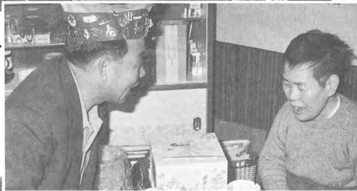
▶ 一人暮しの老人を慰問