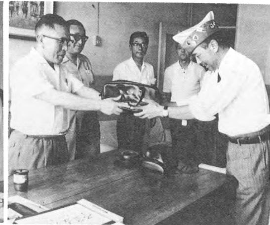
市民プール他4校に若杉式 手動人工蘇生器贈呈 (7月)