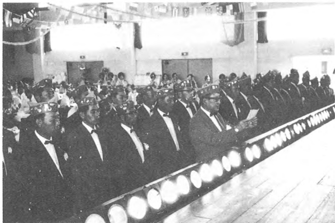
緊張気味で『ライオンズの誓い』