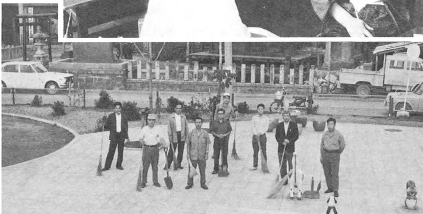
市内お清水児童公園清掃 (9月)