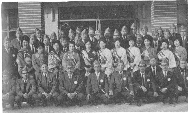
結成式典終り 記念撮影