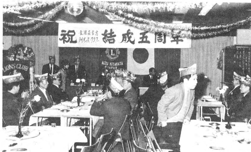
結成5周年記念式と懇親パーティー (46.11)