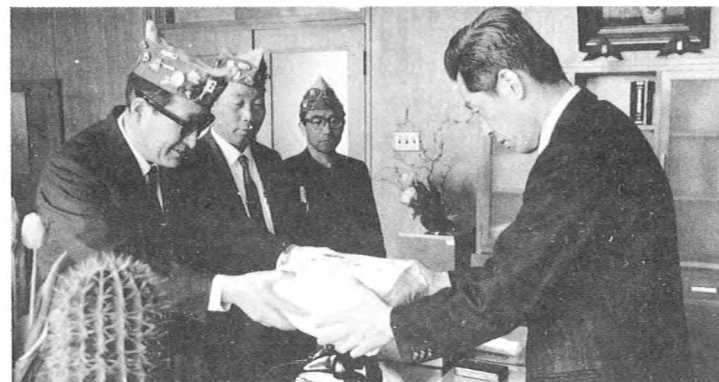
市に除雪作業員用手袋を贈る（1月）