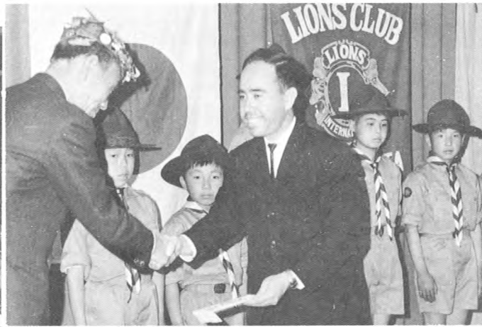
▲ 弥栄、ボーイスカウトに TENT を贈る (45.5)