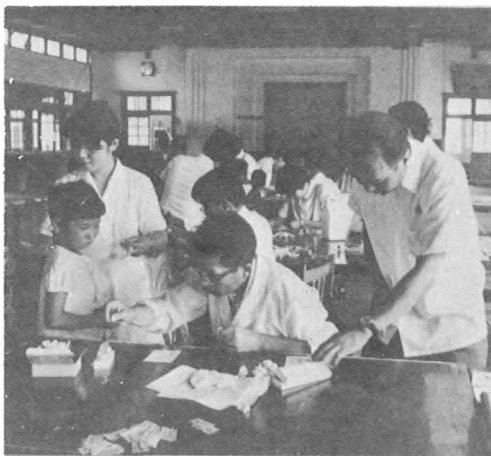
喜多方市立第一小学校生徒全員の血液判定 (8月)