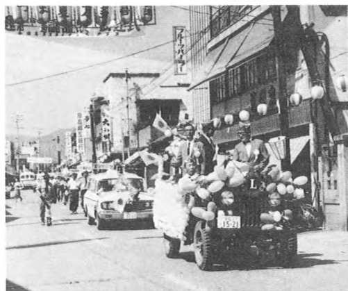
記念市内パレード