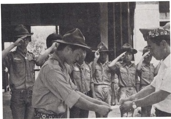
ボーイスカウト日中線無人駅清掃の指導と補助金贈呈（8月）