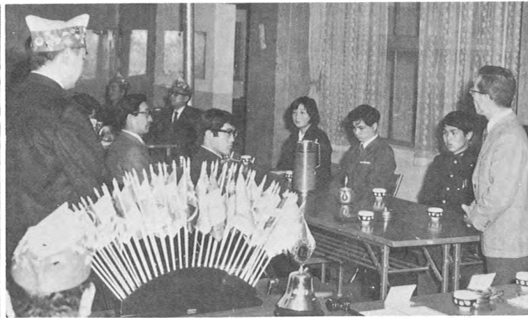
市内4高校、看護学校生徒5名にライオンズ奨学金贈呈 (4月)