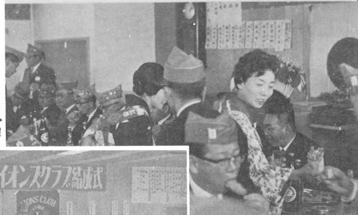
結成記念パーティーでNSの活躍 ▶