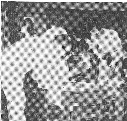
血液型判定の奉仕をするライオンズクラブ員