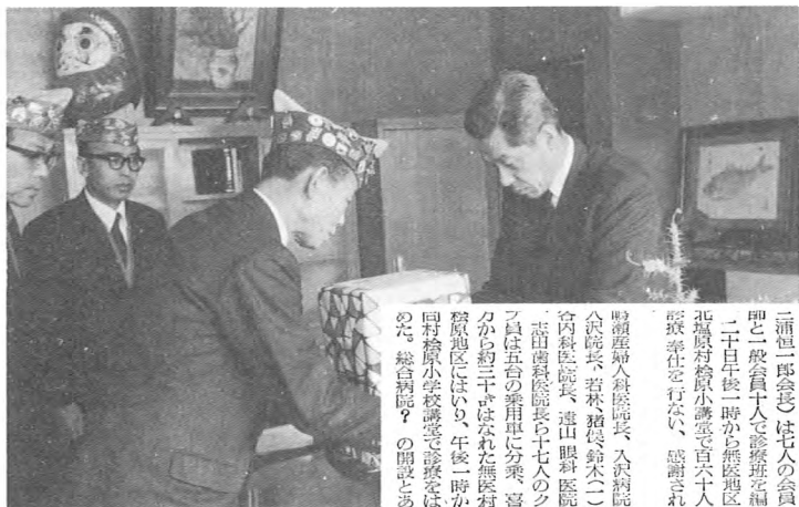
▲ 除雪用手袋を市へ (45.1)