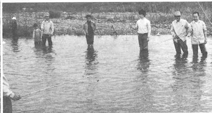
◀ 弥栄、ボーイスカウトにテント一張贈る