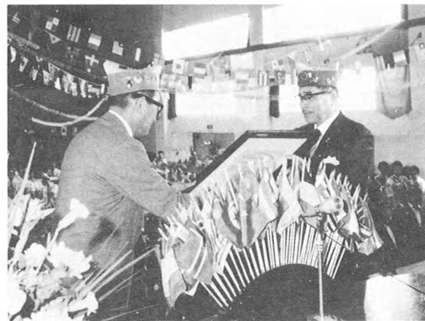
小野ガバナーより初代会長に承認状の伝達