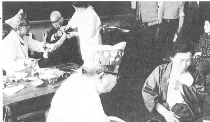
山都町宮古地での無料診療 (5月)