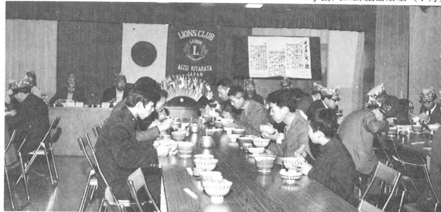
新聞週間にちなみ、新聞少年と夕食を共にし、靴を贈呈 (10月)