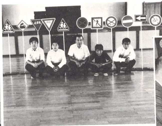
喜多方市立養護学校へ道路標識の模型一式を贈呈（2月）