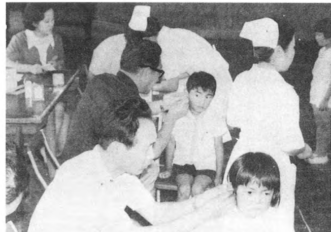
市内小学校で血液型判定奉仕 (46.10)