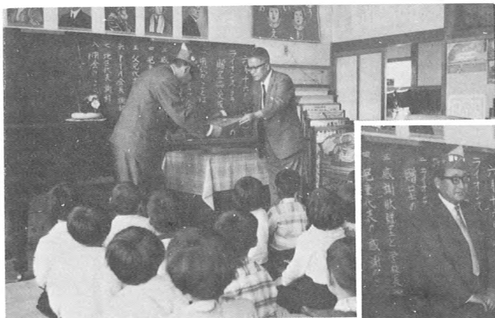
▲ 辺地 雄国分校に医務室用ベットを贈る (6月)

ライオンズのおじさんありがとうございます▶ 雄国分校児童代表感謝のことば (6月)