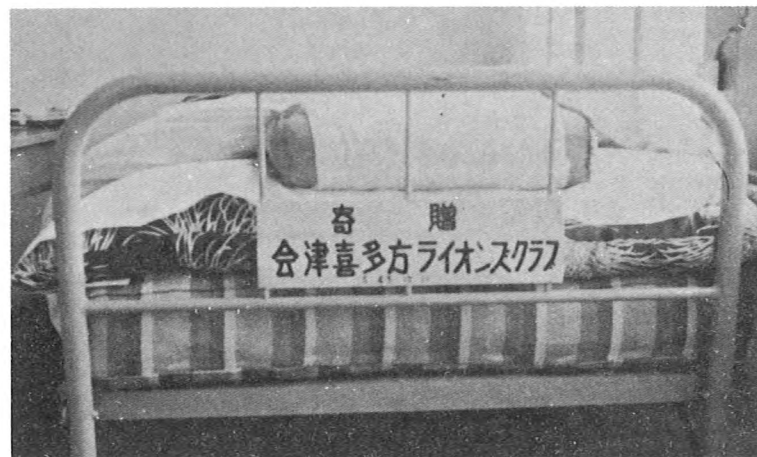
熱塩加納小、五枚沢分校に医務室用ベット一式贈る（12月）